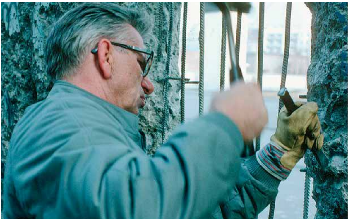
Der Vater des Brandstifters hier in Berlin.