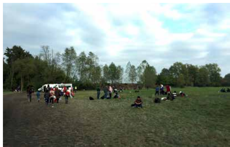
Balkanroute: Zu Fuß durch 4 Länder

Vom griechischen Festland folgt die Route schließlich Bulgarien, Serbien, Kroatien, Slowenien. Zu Fuß, per Bus oder Zug passiert die insgesamt 80 -köpfige Gruppe in 5 Tagen 4 Länder bis sie die österreichische Grenze bei Coccau erreichen. Fast geschafft! Von Kärnten nach Wien und dann steht die letzte Etappe an. Im ICE bis Köln.